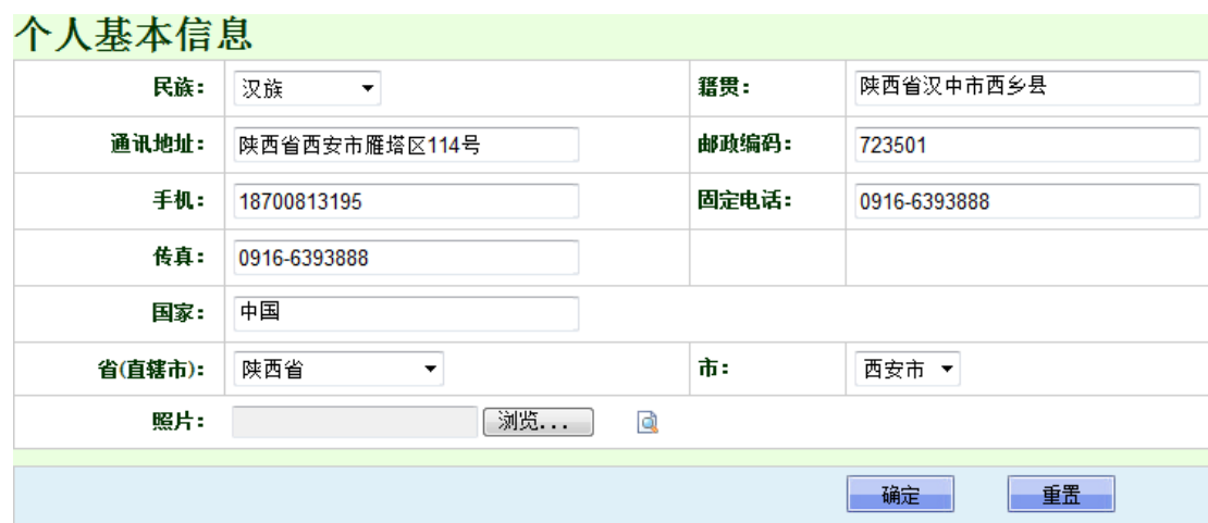
图 2-6 完善资料——个人基本信息