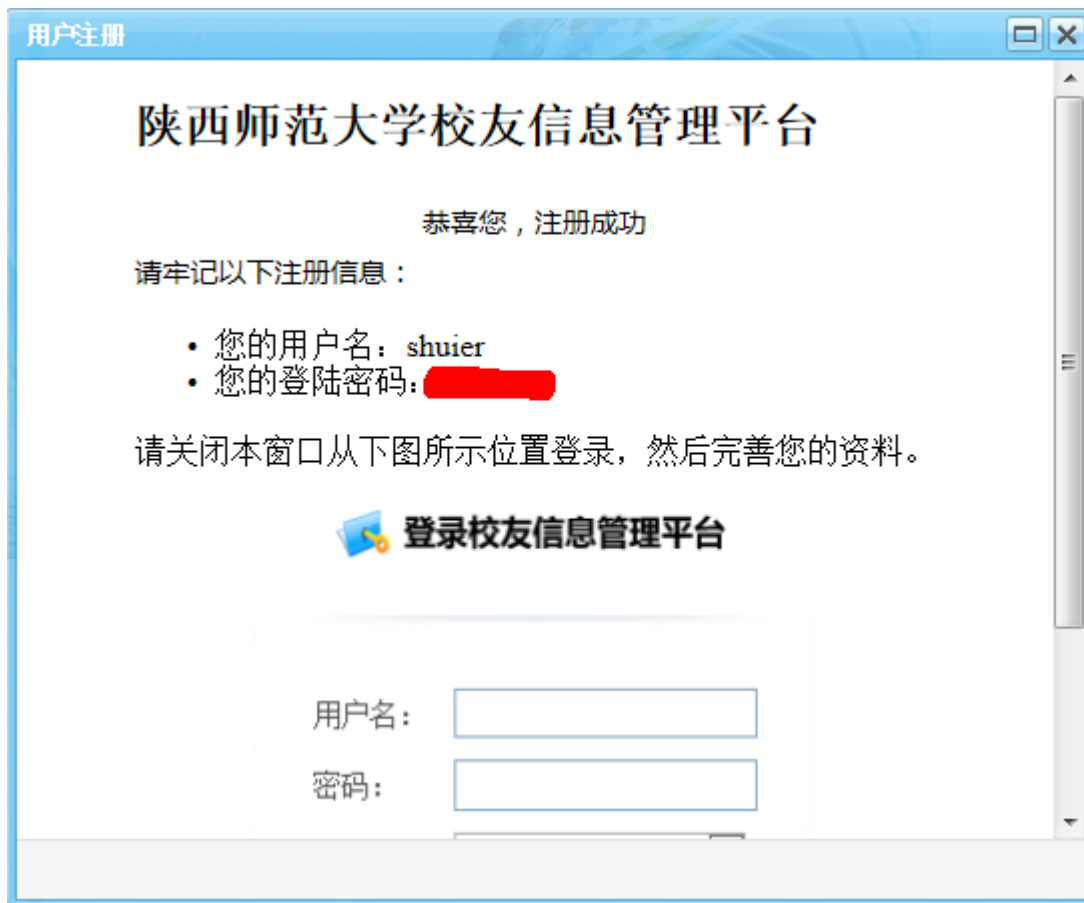
图 1-2 校友（用户）注册成功页面