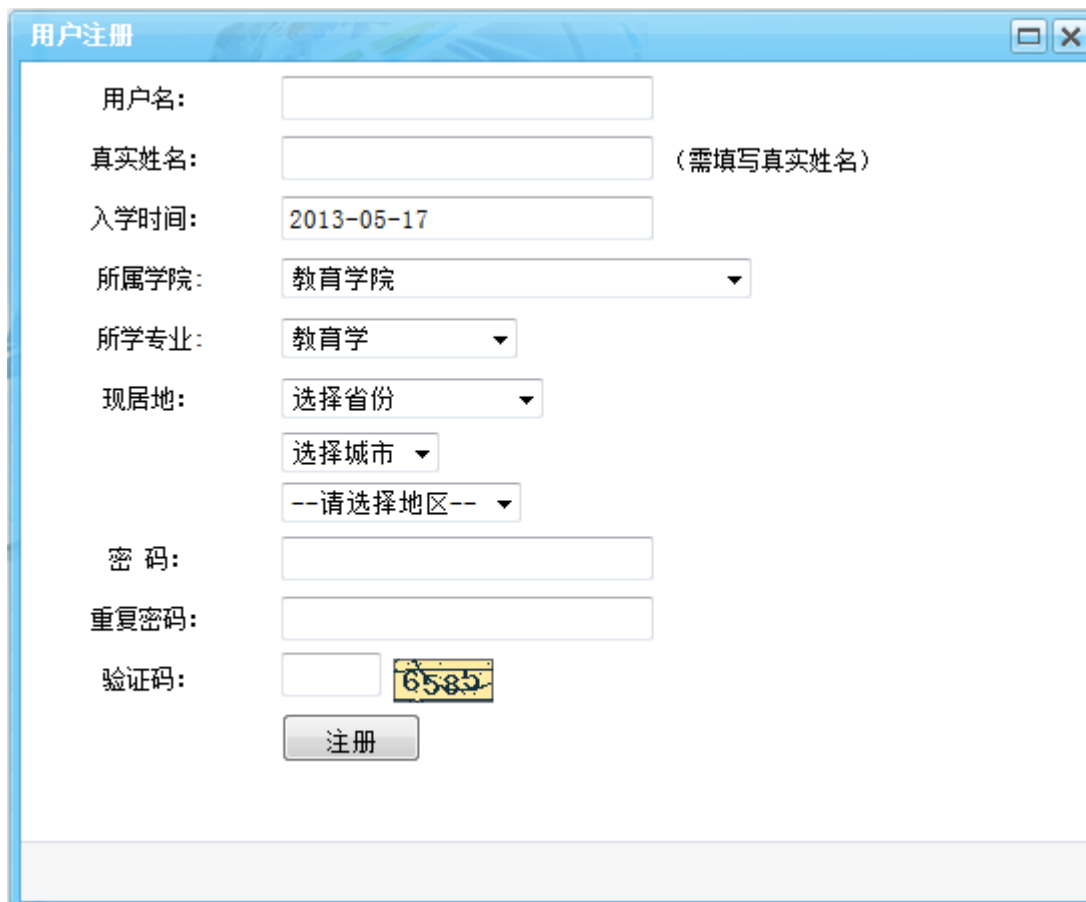
图 1-1 校友（用户）注册页面